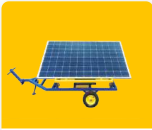
Շարժական Արևային Կայան