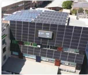
BIPV | BAPV