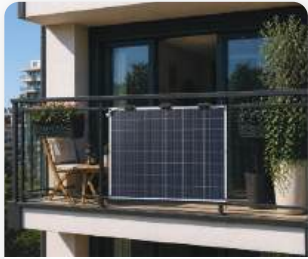
Flex Կիսաճկուն Արևային Վահանակ